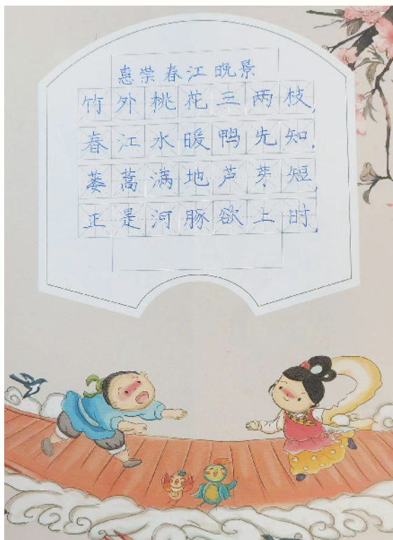
小记者:刘浩行 三(6)班 辅导老师:王闪闪