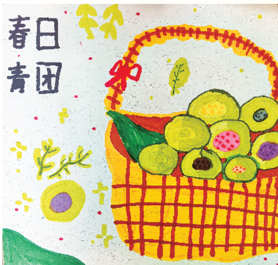
小记者:张钰甯 二(6)班 辅导老师:李小玉